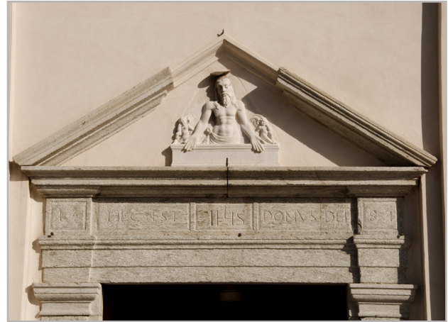
Scultore lombardo, Imago pietatis

Il lavoro dei pittori si conclude nel 1540, mentre le ante oggi perdute, probabilmente temperate su tela, che chiudevano l'ancona nei giorni feriali, si commissionano solo nel 1552 al pittore Mattia Pellizzari del Mussio di Morbegno, allievo di Gaudenzio Ferrari fino al 1546 (Leoni, 1994, pp. 137-138; Sacchi, 1998, pp. 49, 53-54). Non molti anni dopo, nel 1584, l'edificio viene modificato in modo sostanziale con l'aggiunta di una campata; sulla nuova facciata, coronata da un timpano e scandita da quattro lesene, sono sistemati un portale in pietra locale e un bassorilievo in marmo bianco con una Imago pietatis , forse proveniente dalla precedente facciata. Sulla cornice del portale, tra architrave e cimasa, è incisa la sigla latina, intervallata dal cristogramma IHS, «HEC EST DOMVS DEI», cioè «questa è la casa di Dio» (1 Cronache 22, 1). L'interno della chiesa è a una sola navata, con due vaste cappelle laterali. Nella cappella di sinistra, dedicata al Rosario, rilievi in stucco incorniciano affreschi con Storie della Vergine e di San Domenico attribuiti ad Isidoro Bianchi; al Bianchi spetterebbero anche i tondi con i Misteri del Rosario , dipinti ad olio su rame, inseriti nella cornice della nicchia centrale (Coppa, 1998, p. 112).