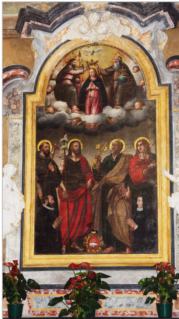
Antonio Canclini (?), La Vergine coronata dalla Trinità con San Francesco, San Giovanni Battista, San Pietro, San Giovanni Evangelista (?) e donatori