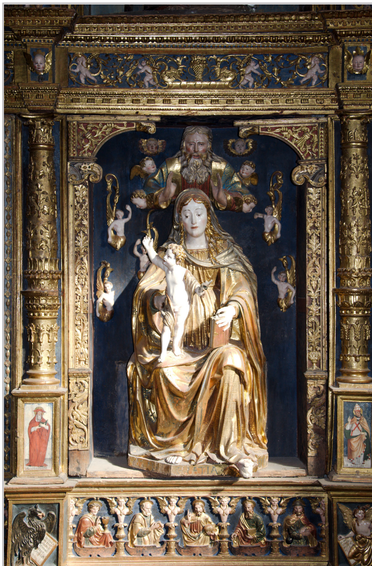
Giovanni Angelo del Maino, Ancona di San Lorenzo , particolare